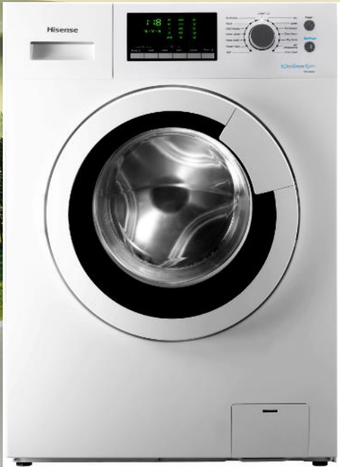
Lave linge hublot WFU6012