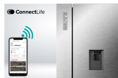
Contrôle à distance (wifi)

De l'air froid doux est diffusé à chaque étage via des colonnes d'air, afin de maintenir une température uniforme dans tout le réfrigérateur.