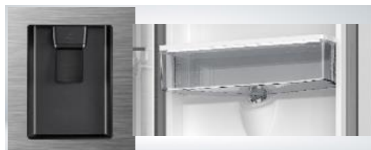
Distributeur d'eau en façade

De l'eau fraîche à tout moment de la journée grâce au réservoir non relié à l'arrivée d'eau. Aucune perte d'espace, installation rapide et facile.