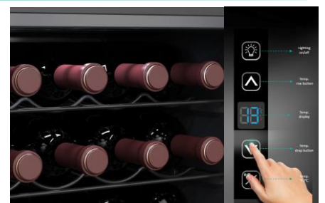
Interface de contrôle digitale intérieure

Cette cave à vin répond donc à une large variété de besoins de stockage.