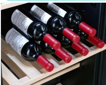
Clayettes en bois

Grâce à ses 3 clayettes en bois coulissantes, il est très facile de visualiser le contenu de la cave à vin.