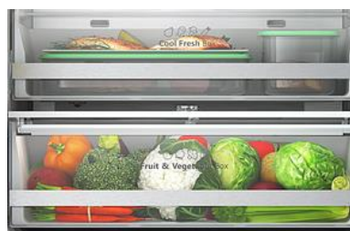
Bac à légumes avec contrôle d'humidité + Compartiment fraîcheur

Grâce au metal cooling, votre réfrigérateur descendra en température plus rapidement, la stabilité de la température sera améliorée et il bénéficiera d'un design plus contemporain.