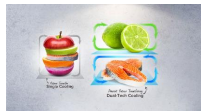
Dual tech cooling

Grâce à ses 37 dB, ce réfrigérateur fait parti des plus silencieux du marché. Il s'intégrera donc parfaitement dans une cuisine ouverte.