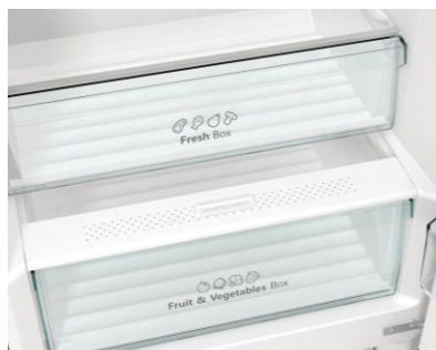
Bac avec contrôle d'humidité

Grâce à l'ouverture de porte sans débord, il est possible d'installer le réfrigérateur directement contre un mur et d'utiliser l'ensemble des tiroirs en toute simplicité.