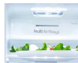
Multi Air Flow

Le réfrigérateur FSN535 dispose d'un distributeur d'eau, de glaçons et de glace pilée automatique.