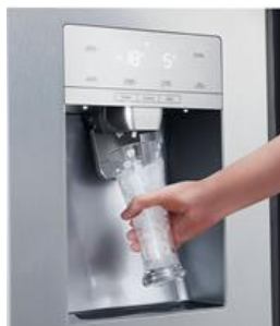
Distributeur d'eau et de glaçons

Le réfrigérateur FSN535 dispose d'un distributeur d'eau, de glaçons et de glace pilée automatique.