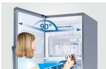
Ouverture à 90°

La porte s'ouvre jusqu'à 90° pour sortir les tiroirs sans effort