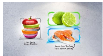
Dual tech cooling

Grâce à ses 39 dB, ce réfrigérateur fait parti des plus silencieux du marché. Il s'intégrera donc parfaitement dans une cuisine ouverte.