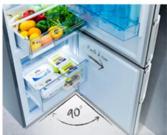
Ouverture à 90°c sans débord

Grâce à l'ouverture de porte sans débord, il est désormais possible d'installer le réfrigérateur directement contre un mur. Il est également possible d'utiliser l'ensemble des tiroirs en toute simplicité.