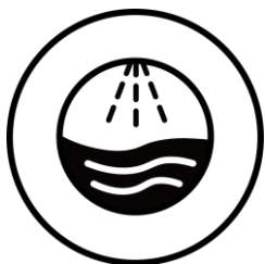
Pure Jet Wash

Un débit d'eau puissant et rapide pour un nettoyage efficace