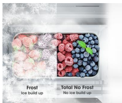
Froid ventilé (NoFrost)

De l'air doux est diffusé de manière homogène à chaque étage. Les aliments conservent ainsi leur fraîcheur plus longtemps. Fini le givre à l'intérieur de l'appareil grâce à ce système de froid ventilé.